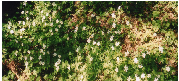
Hvitveisen blomstrer villig om våren

Marka ble etter hvert mer brukt som utfartsterreng, noe en måtte ta hensyn til også når det gjaldt plantinga. Av denne grunn er ikke hustomta ved Estenstad og Tømmerholt tilplantet. Det samme gjelder Øvergjerdet, men der har det grodd igjen en del av seg selv. Når det gjelder Endreområdet ble det tilplantet i mellomkrigsåra, så der er det stor skog. Etter tynningshogst i de senere år er grunnmurene godt synlige. Den bratte lia fra Øverdammen og opp mot Endreplassen ble tilplantet først på 1950-tallet.