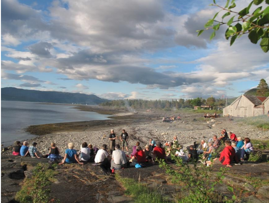
Flatholman i Malvik kommune ble ervervet som offentlig eid friluftsområdet i 2011.