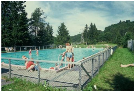
Svean bad i sine glansdager.

Det er foretatt tilrettelegging på det sikrede området Svean og Moodden i Klæbu med å få bedret tilgjengelighet ned mot Nidelva, gapahuker og opprusting av stinettet i området. Et flott område egnet til allsidig aktivitet tett på Nidelva.