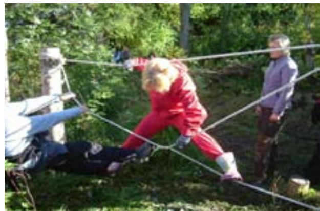
Uteaktivitet praktiseres på idesamlinger

Trondheimsregionens Friluftsråd, Tempevegen 22, 7004 Trondheim