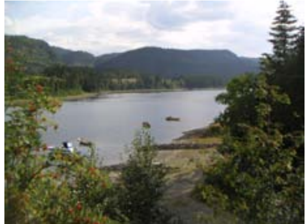
Strandsonen langs Selbusjøen er fine og viktige friluftsområder for fremtiden