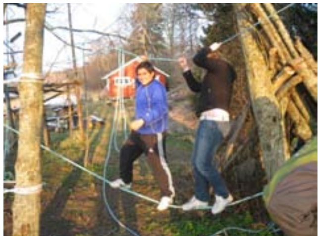
Praktiske kurs rettet inn mot voksenpersonell som jobber med barn og unge – "fullspekket" med tips og ideer til uteaktiviteter.

I 2007 er det gjennomført uteaktivitetskurs hvor vi har hatt tilsammen 153 deltagere fra ulike skoler, barnehager og utdanningsinstitusjoner som jobber for både barn, unge og eldre. Kursene er i all hovedsak avviklet på Trondheimsregionens faste kurssted "Naustet" på Torp i Malvik kommune.