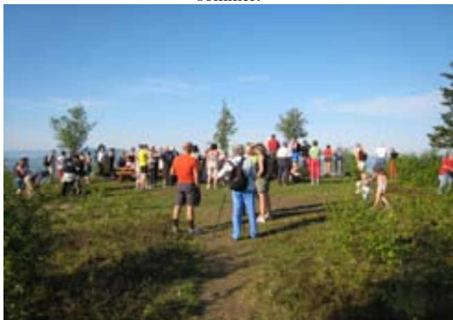
Ordførernes tur i forbindelse med markeringen av at frilufsloven var 50 år ble et populært tiltak. Her fra Våtten i Skaun.