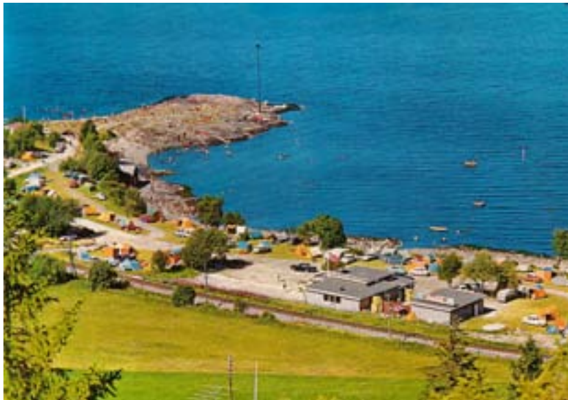
Vikhammeløkka på 1960-tallet.

Det interkommunale friluftslivssamarbeid startet i Trondheimsregionens ved etableringen av Trondheim og Omlands Friluftsråd 25. september 1936. Trondheim, Strinda, Malvik, Byneset og Tiller kommuner var medlemmer. Trondheim og Omlands Friluftsråd var sterkt medvirkende til at Trondheim kommune i 1936 kjøpte NSB's eiendom på Vikhammeløkka til friluftsområde. Det forhindret at området ble lagt ut til hyttebygging. Eiendommen ble straks stilt til rådighet for friluftsrådet som bade- og friluftsområde. Rådet hadde ansvaret for området til 1982 da Trondheim og Omlands Friluftsråd ble avviklet. Trondheimsregionens friluftsråd slik vi i dag kjenner det interkommunale samarbeidsorganet ble etablert 23.februar 1978. Friluftsrådet feirer 30 års jubileum i 2008.