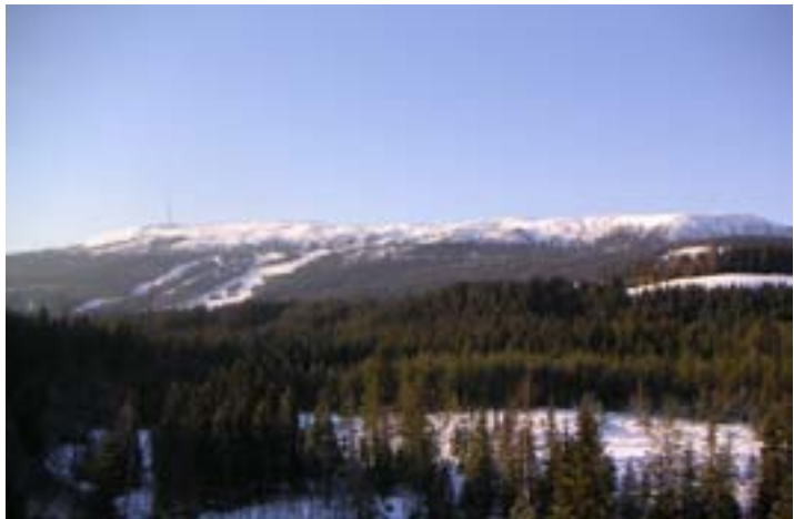
Vassfjellet er et populært regionalt og bynært turområdet med både rike fjell – og markaområder.

løypestraseen fra Skjøla til Vassfjelltoppen og nye skilt og merking er satt opp. Vestre Vassfjellet Grunneierlag og trimgruppa i Melhus I.L. har igangsatt opprusting av turstien og skiløypa fra Løvsethaugen til Vassfjellhytta med støtte fra friluftsrådet.