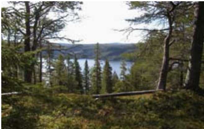
Nytt turkart "På tur i Brungmarka i Klæbu" viser mulighetene og inspirerer til turer i området vinter og sommer.