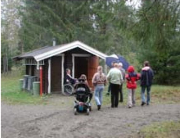
Universell utforming av friluftsområder skal ivaretas ved tilrettelegging for friluftsliv