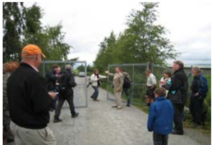
Midsandtangen friluftsområde ble offisielt åpnet og befolkningen ble ønsket velkommen for første gang