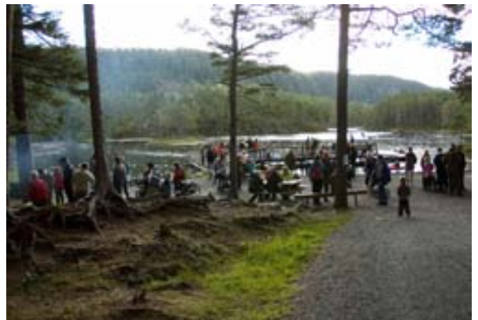
Friluftsdagen ved Stavsjøen samlet nærmere 400 deltakere til en flott friluftsdag med mange aktiviteter.