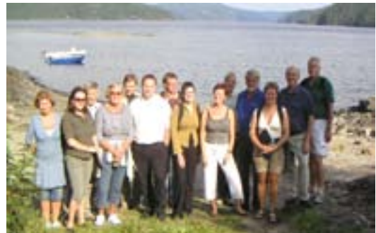
Strandsonen ved Selbusjøen er et viktig område for framtidens friluftsliv.