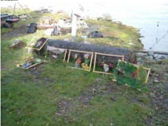
153 deltakere har fått ideer og tips om uteaktiviteter i skoler, barnehager og SFO