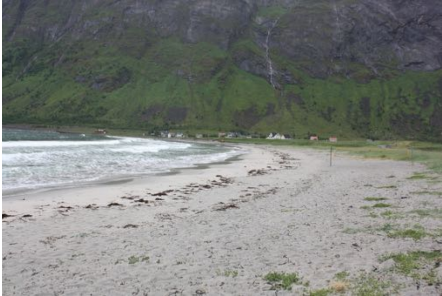
Ersfjordstrand i Berg kommune

Midt- Troms friluftsråd har bidratt i denne prosessen med blant annet utarbeidelse av handlingsplan for universell utforming av Ersfjordstranden.