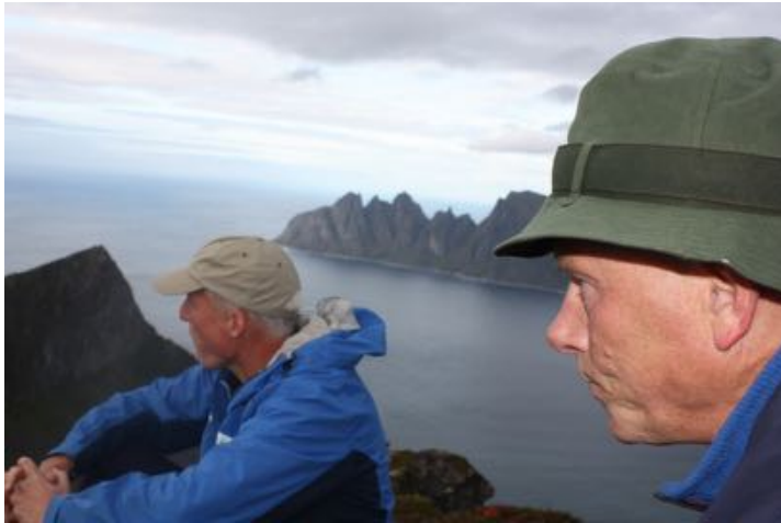
Styremøte med befaring 2.og 3. sept i Berg