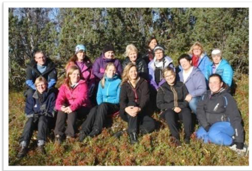
Barnehagenettverket på samling oktober 2014