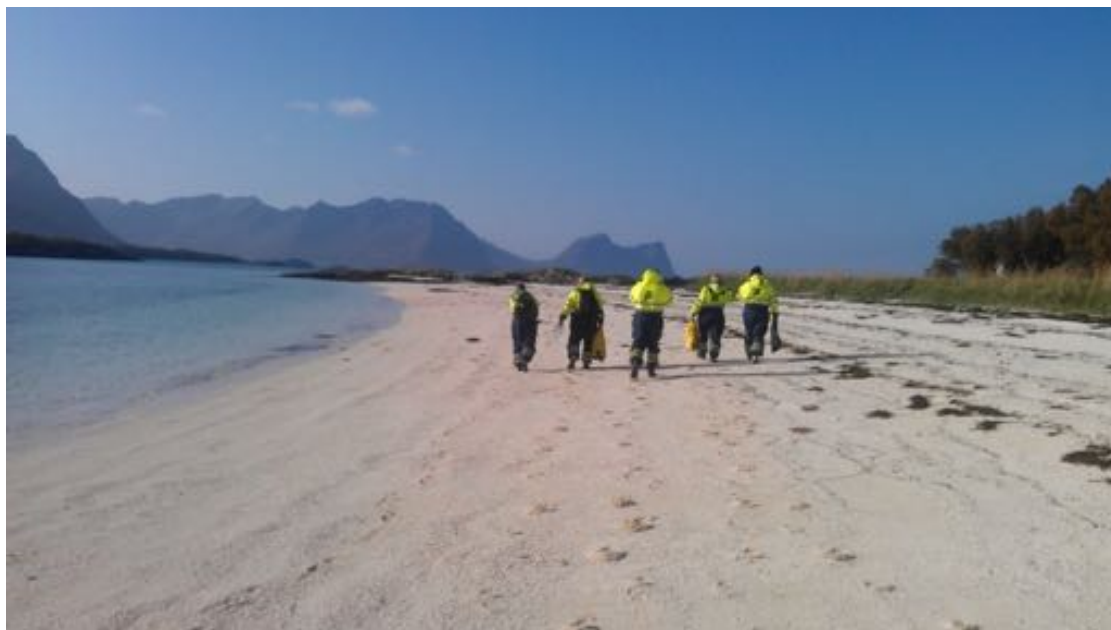
Friluftstur innen psykisk helsevern. Færøya 2014

Tilbakemeldingene fra kommunene er at de er fornøyde med fellestilltakene innen friluftsliv og folkehelse, og ønsker videre samarbeid om fellestilltakene.