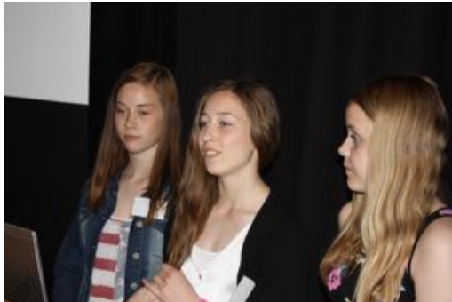
Presentasjon av spørreundersøkelse på konferanse "Aktiv i Midt-Troms" 5. juni 12

3. og 4. September ble det arrangert 2 dagers styremøte med prosess og befarings.