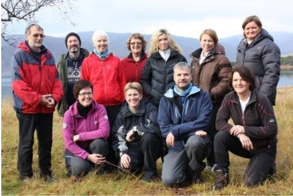
Deltakere på nettverkssamlingen på Refsnes i Tranøy, okt 2012