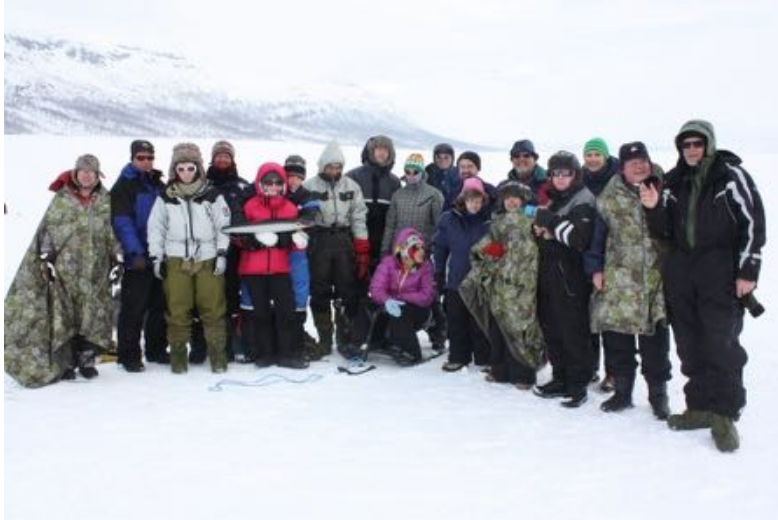
Isfisketur på Altevatn