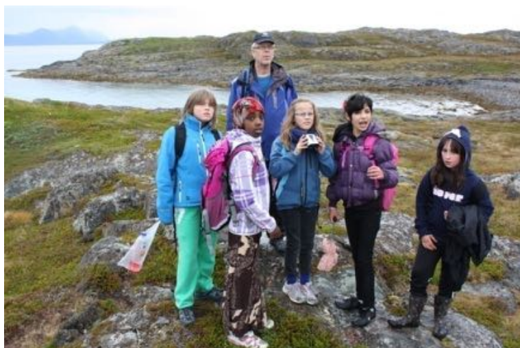
Ørnetitting på ordførerens tur i Tranøy.