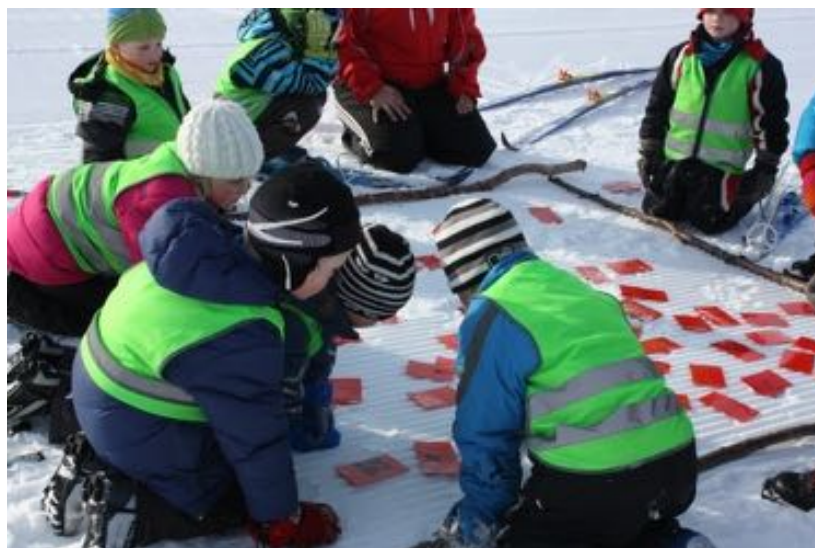
Fra skiaktivitetsdag for barnehagene og skolene i Bardu.

Bedre tilgang til scenen for FH Oppgradering av bygning og brygge Bord og benker tilrettelagt UU Sittegrupper på stranden UU