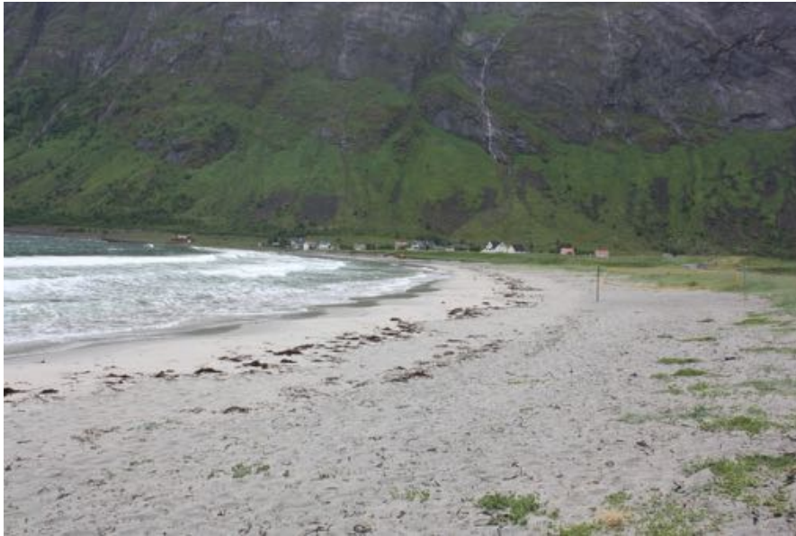
Ersfjordstrand i Berg kommune

Midt- Troms friluftsråd har bidratt i denne prosessen med blant annet utarbeidelse av handlingsplan for universell utforming av Ersfjordstranden.