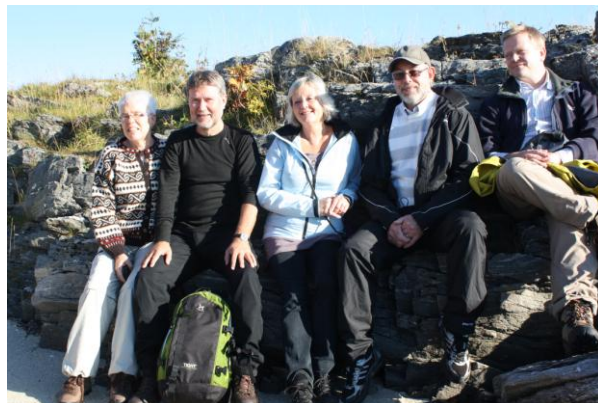
Styret i FL på befaring i Henrikstøa, Finnsnes

Friluftsrådet var lokalt vertskap for styremøte i Friluftsrådenes