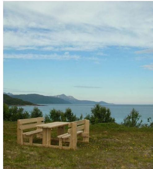
Nye sittegrupper i Sørvika.

Regjeringas tiltakspakke vinteren 2009 ga muligheter for iverksetting av prosjekter som ikke lå i handlingsplanen. Det ble søkt om 250.000,- til oppgradering av Sørvika og søknaden ble innvilget. Med utgangspunkt i forvaltningsplanen er det iverksatt flere tiltak, bl.a. rydding av skog, riving av gammelt gjerde og oppsetting av nytt, oppsetting av to overbygde bålplasser og oppsetting av nytt toalettbygg. En regnfull høst 2009 og en dårlig sommer i 2010 har ført til at tilretteleggingen er noe forsinket. Åpning av ”nye Sørvika” er satt til juni 2011.