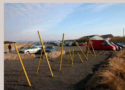
Her har vi arkitekttegnet sykkelparkering knyttet til bilparkering.