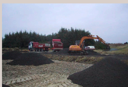
Toppdekket er granulert asfalt. Det drenerer godt og er stabilt