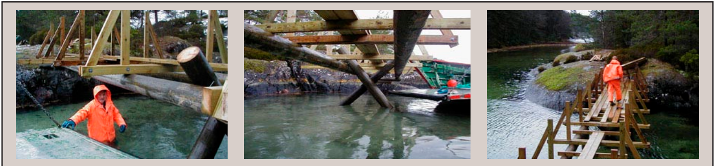
Rekkverkstolpene og skråstøttene blir festet med gjennomgående bolter.