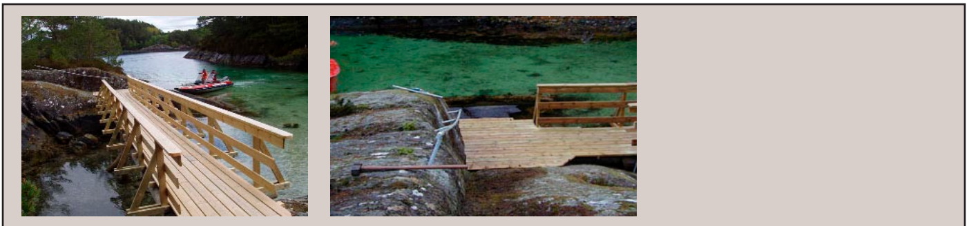
Rekkverket ferdig med håndlist av 36 x 148.